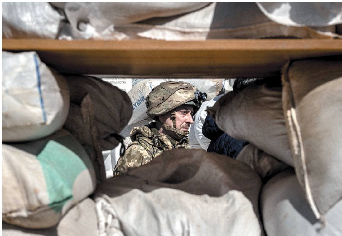
Soldado ucraniano vigia barricada na cidade de Zhytomyr, no nordeste do país

O presidente ucraniano, Volodymyr Zelenskiy, vai participar, hoje, da cúpula da Otan e a afirmação de Peskov soou como uma ameaça, já que um dos objetivos alegados pela Rússia para invadir a Ucrânia, é im-